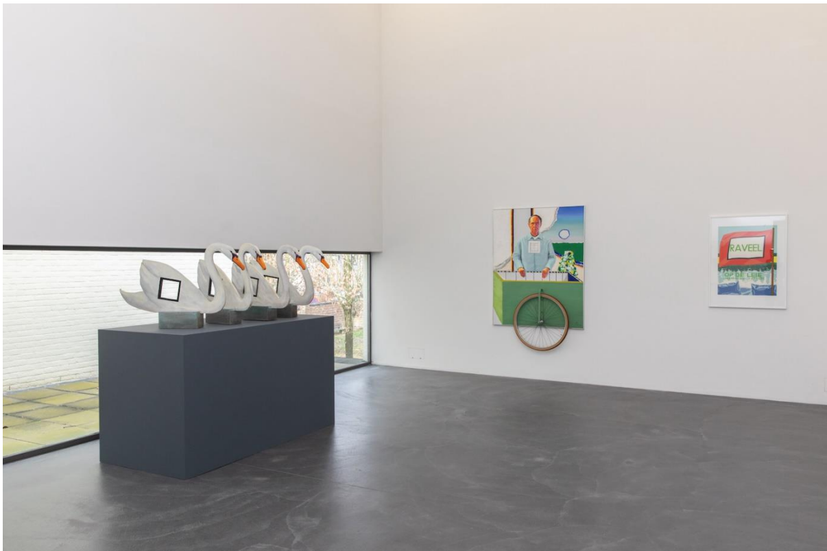
Vue de l'exposition Roger Raveel. L'essence

En l'honneur du 25e anniversaire du Musée Roger Raveel, l'exposition L'épouvantail du musée se concentre plus que jamais sur l'héritage de l'artiste belge emblématique Roger Raveel. Onze artistes contemporains sont invités à s'intéresser à l'œuvre de Raveel, à sa vie, à son musée et à son village, chacun dans la perspective de ses propres intérêts et pratiques. Presque toutes les interventions sont de nouvelles créations qui seront nichées dans, entre et autour de l'exposition Roger Raveel. L'essence . Cette exposition globale, qui a déjà ouvert ses portes le 23 mars, évoluera, se transformera et sera activée par les artistes invités au fil des mois.